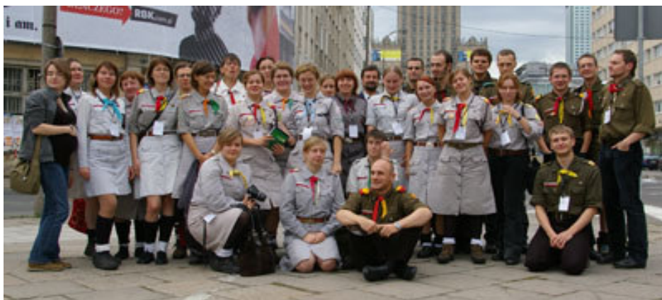
VIII Zjazd SH w pełnej krasie